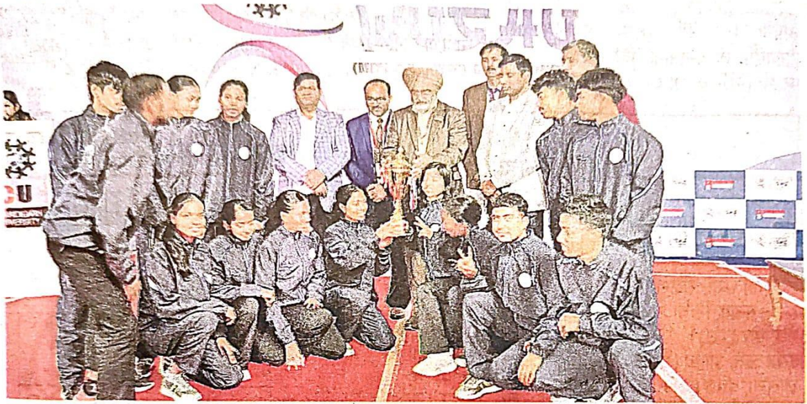
पुरस्कार के साथ रांची विश्वविद्यालय की टीम

जागरण संवाददाता, रांची: चंडीगढ़ यूनिवर्सिटी में चल रहे आल इंडिया यूनिवर्सिटी गेम्स में रांची यूनिवर्सिटी के खिलाड़ियों ने वुशु में शानदार प्रदर्शन करते हुए ताउलु प्रतिस्पर्धा में तीसरा स्थान प्राप्त किया। रांची यूनिवर्सिटी के खिलाड़ियों ने कुल चार गोल्ड, पांच रजत व आठ कांस्य पदक जीते। रांची के खिलाड़ियों ने ग्रुप व डुएल इवेंट में स्वर्ण जीता।