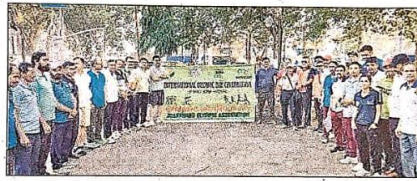
रांची में रविवार को ओलंपिक डे के मौके पर एकत्रित जेओए पदधारी, कोच तथा खिलाड़ी।

वालिका वर्ग में एसएस क्लब ने रेड पोकोरानी को 10-4 से और बालक वर्ग में लिटिल टाइगर 6-5 से