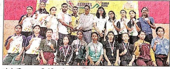
खेलो इंडिया वुशु प्रतियोगिता में पदक प्राप्त करनेवाले झारखंड के खिलाड़ी।