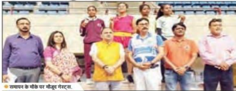
समापन के मौके पर मौजूद गेस्ट्स.