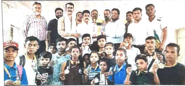
राज्य सब जूनियर वुशु प्रतियोगिता में खिताब जीतनेवाली रांची जिला टीम।