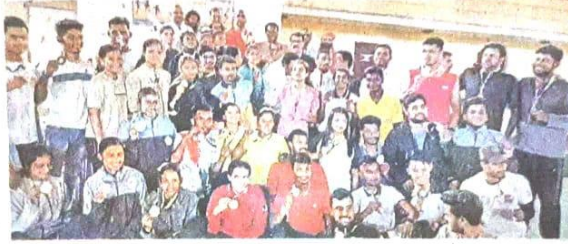
पदक के साथ विजेता खिलाड़ी